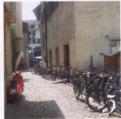
GRASSIS VELO-WASCHSTRASSE «Man steckt sein Velo in eine Schiene, und es wird hin- und hergeschrubbt. Faszinierend. Der perfekte Ort, einem Amerikaner die Schweiz zu erklären.» Hammer 3, 062 822 22 14